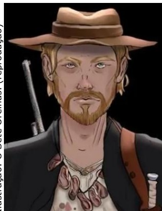
Ilustração: O Sete Orelhas.